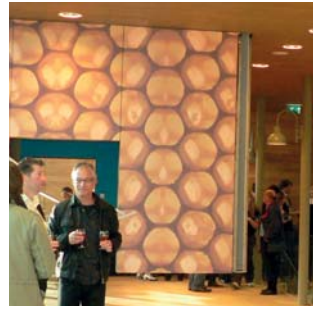
V.l.n.r.: Detail ontwerp, productie print-hpl en verwerkt op locatie

Deze onderdelen zijn ondergebracht in aparte boxen rond een centraal plein in de VU Kinderstad. Sommige van deze thema-boxen 'zweven' in de ruimte, terwijl andere door de gevel naar buiten steken. SPONGE Architects ontwierp voor de wanden en gevels van elke box een aparte print. Muur 2 bv werd door de architect betrokken bij de digitale opmaak en technische uitwerking van deze sfeerversterkende wand- en gevelbekleding. ←